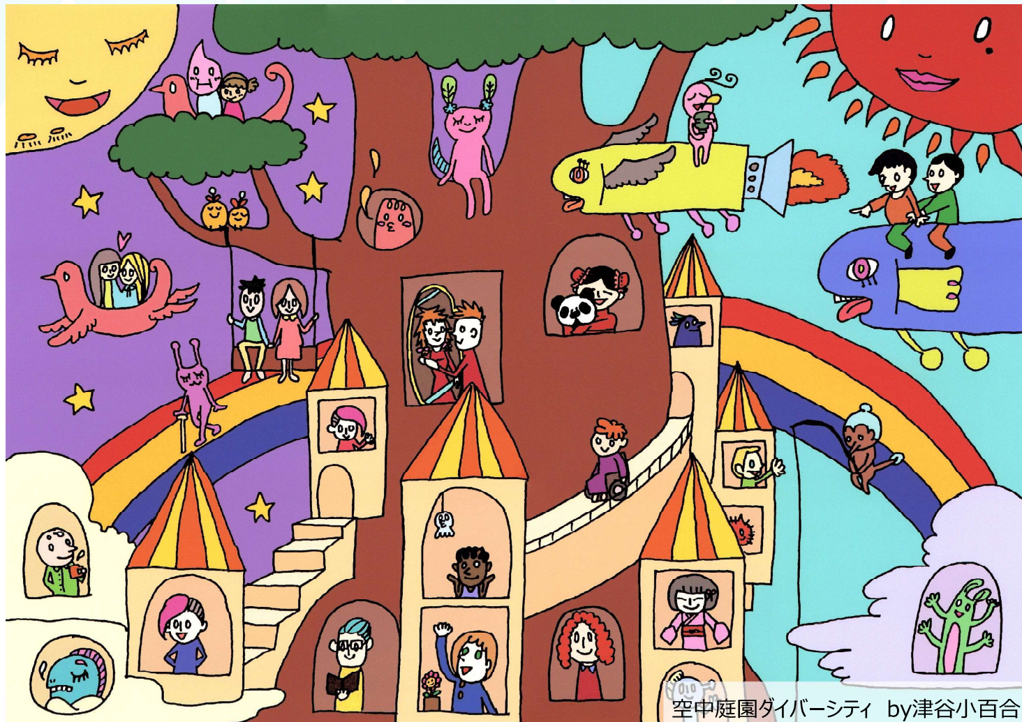
空中庭園ダイバーシティ by津谷小百合